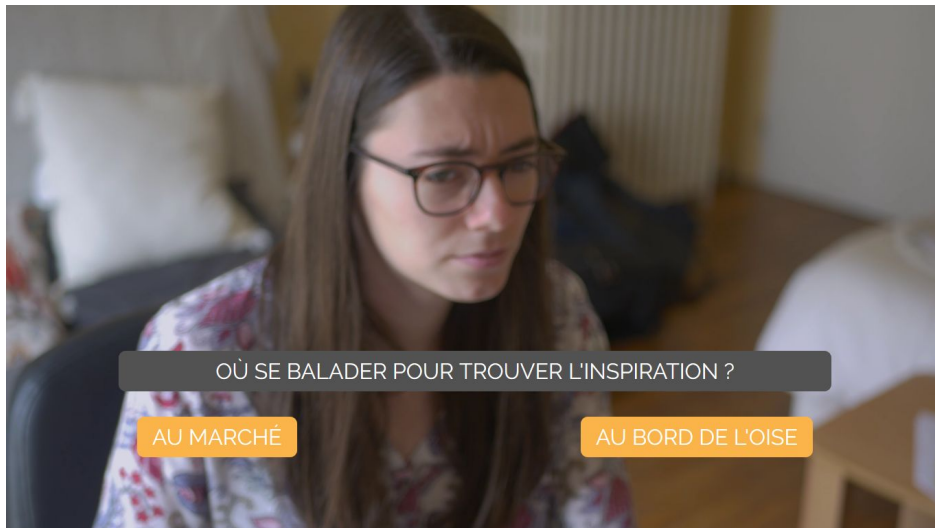
Écran de sélection des choix lors de la lecture du court-métrage

Le site dispose de 3 pages différentes : la page d'accueil, la page vidéo et la timeline. Ces 3 pages partagent la même charte graphique afin de conserver une cohérence entre celles-ci. Pour faciliter l'interaction et l'intuitivité, l'ensemble des éléments cliquables changent de couleur lorsqu'ils sont survolés.