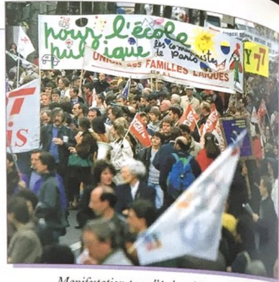
Manifestation pour l'école publique.