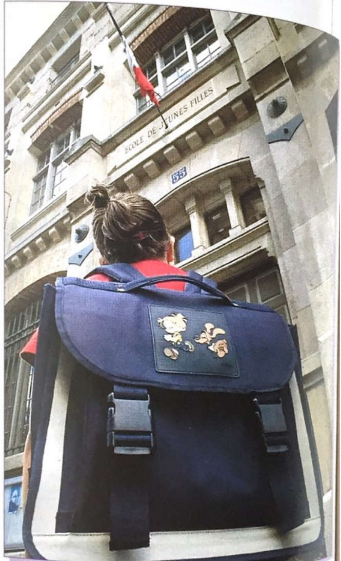
Une écolière à la porte d'entrée de son école. L'école est obligatoire jusqu'à 16 ans.

Pour les Français, l'école doit permettre d'abord de trouver un travail ; mais son rôle est aussi de donner une culture générale, de