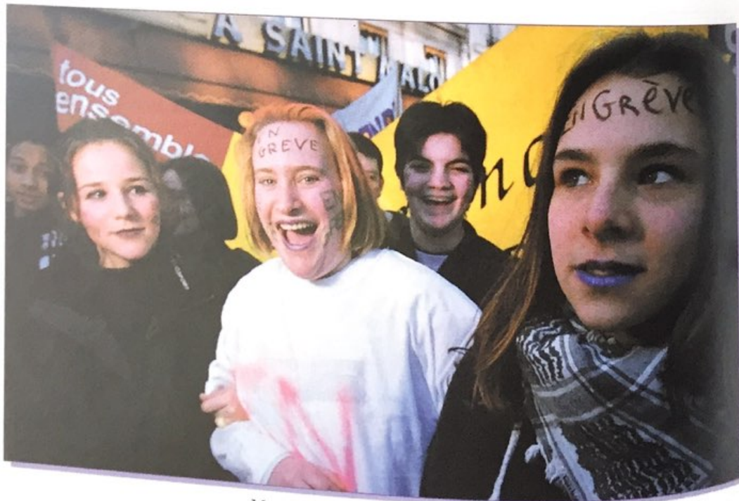
Manifestation de lycéennes et de lycéens.