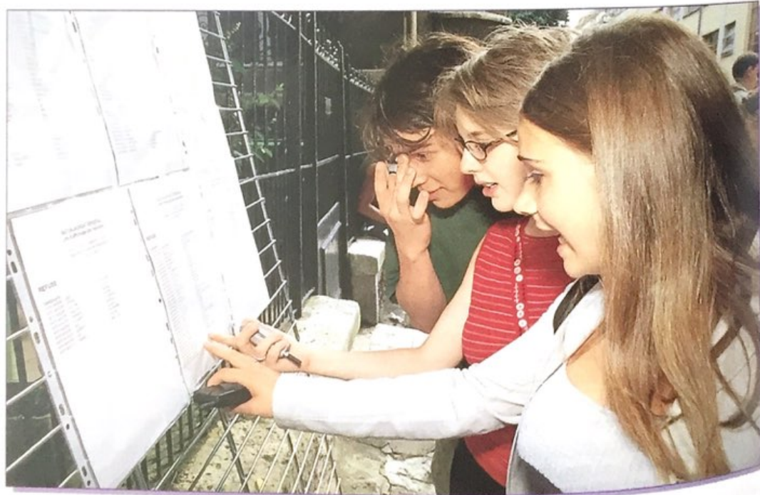
Des candidats au baccalauréat apprennent leurs résultats.

Le coût total de la scolarité est estimé à 76 000 € par enfant : l'État finance 65 %, les communes ou régions 20 %, les parents 7 %, les entreprises 6 %.