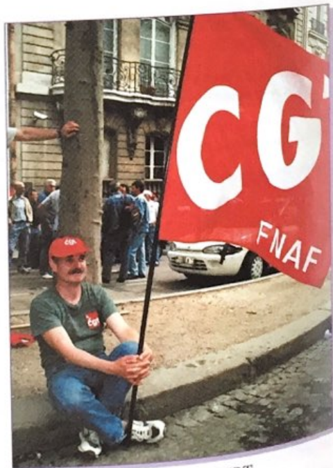
La CGT et la CFDT sont les deux principaux syndicats.

tions sans conflits sociaux : la France a la réputation d'être le pays des grèves (infirmières, cheminots, étudiants, routiers et de manifestations paysannes surtout).