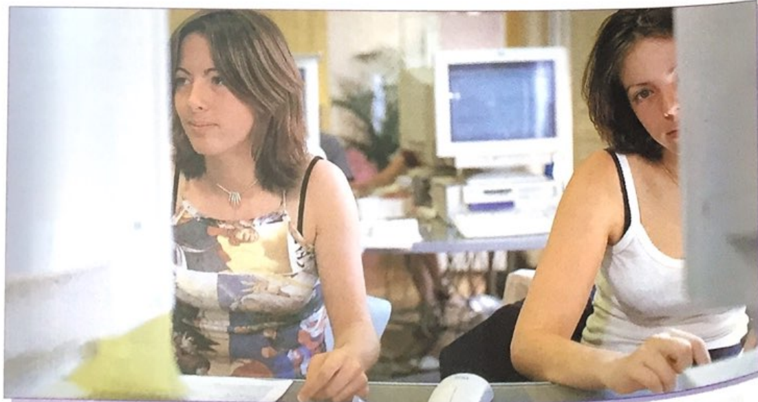
Le temps des « start-up » : la maîtrise des technologies est aujourd'hui essentielle.

Une nouvelle génération est née qui a grandi avec le chômage : elle a une autre culture et ses maîtres mots sont flexibilité et adaptabilité , émulation et dépassement de soi. Elle bouleverse hiérarchies, rôles, carrières et ambitions ; elle exige hiérarchies plates, processus de décision rapide et participation. Elle a un mot d'ordre : réussir vite , et un atout : la maîtrise des technologies de l'information et de la communication.