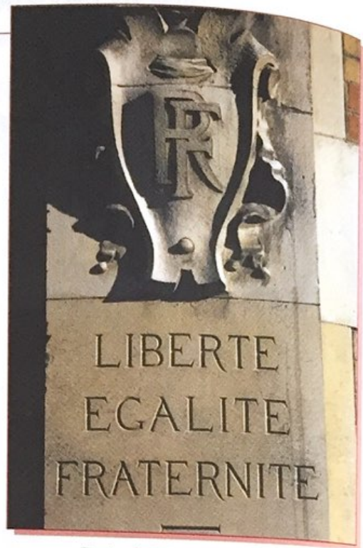
Devise de la République française.

L'identité française a aussi ses lieux symboliques : Versailles, Notre-Dame, l'Arc de triomphe, le Panthéon, le mur des Fédérés, Verdun, le mont Valérien, l'Académie française, la tour Eiffel. Enfin, elle a ses lieux familiers : la mairie, le clocher et le monument aux morts de chaque village de France.