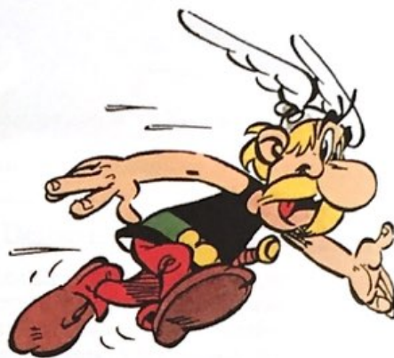
Astérix le Gaulois.

Bien que le nom « France », après l'invasion des Francs, ait remplacé le nom « Gaule » pour nommer le pays, ce sont les Gaulois que la mythologie désigne comme les ancêtres des Français.