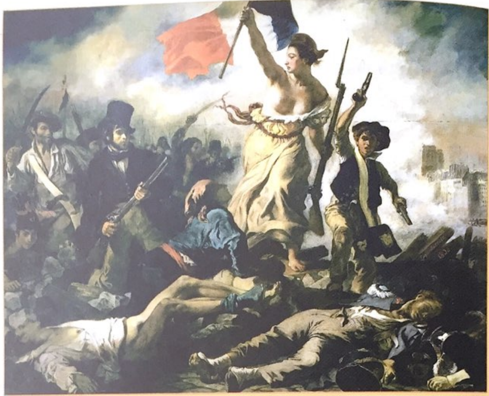
La Révolution de 1830 : La Liberté guidant le peuple (Eugène Delacroix, 1831).