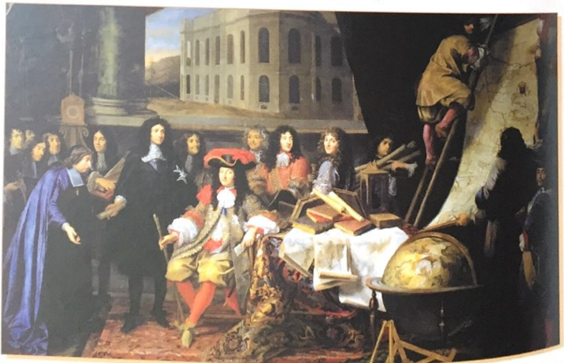
Établissement de l'Académie des sciences par Louis XIV (Testelin).

La querelle des Anciens et des Modernes (1680) met fin à la domination du classicisme et de la culture d'État ; elle annonce déjà le siècle des Lumières .