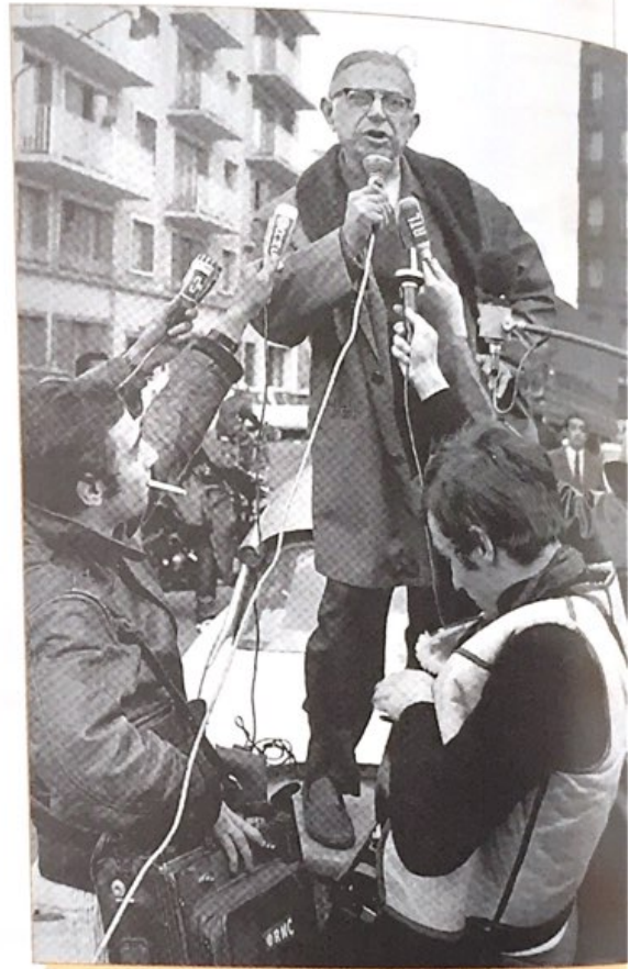
Le 16 octobre 1970, La Cause du peuple , journal révolutionnaire, est censuré et interdit de vente par le gouvernement français. Jean-Paul Sartre, rédacteur en chef de ce journal, tient une conférence de presse pour le défendre.

Le Nouveau Roman fait partie de cette remise en question de la littérature qui a marqué l'après-guerre. Il réunit des romanciers qui ont d'abord en commun d'avoir le même éditeur (Les Éditions de Minuit). Chacun à sa manière va illustrer cette