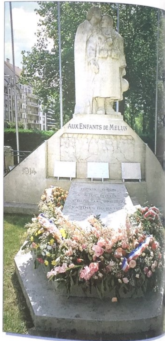
Monument aux morts des deux guerres mondiales.

La défaite de juin 1940 illustre une France qui n'a pas su maîtriser les conséquences de sa victoire de 1918. De 1940 à 1945, elle va connaître une des plus graves crises de son histoire : la défaite, l'Occupation, l'humiliation, la misère, le pillage de ses ressources, la Collaboration et la division. De Gaulle, la résistance intérieure et extérieure la sauveront de la catastrophe et permettront sa reconstruction.