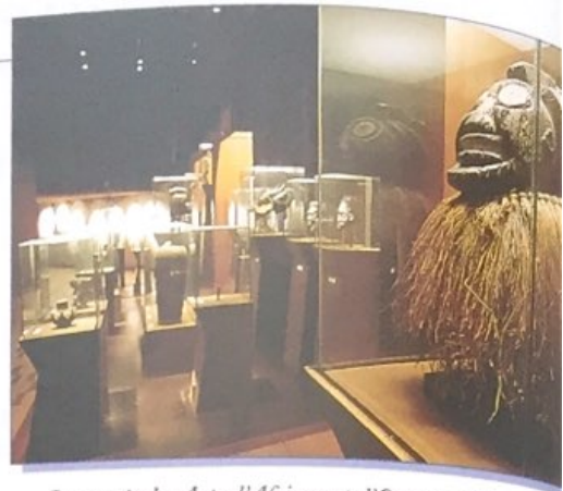
Le musée des Arts d'Afrique et d'Océanie à Paris.

De la colonisation française, il reste une forme d'urbanisme (Vieux Carré à La