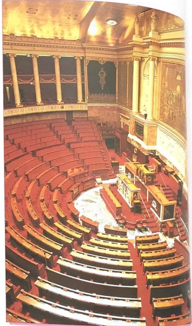
L'hémicycle de l'Assemblée nationale où siègent les députés et les membres du gouvernement (au premier rang).

• le Conseil constitutionnel (9 membres), qui veille à la constitutionnalité des lois ;