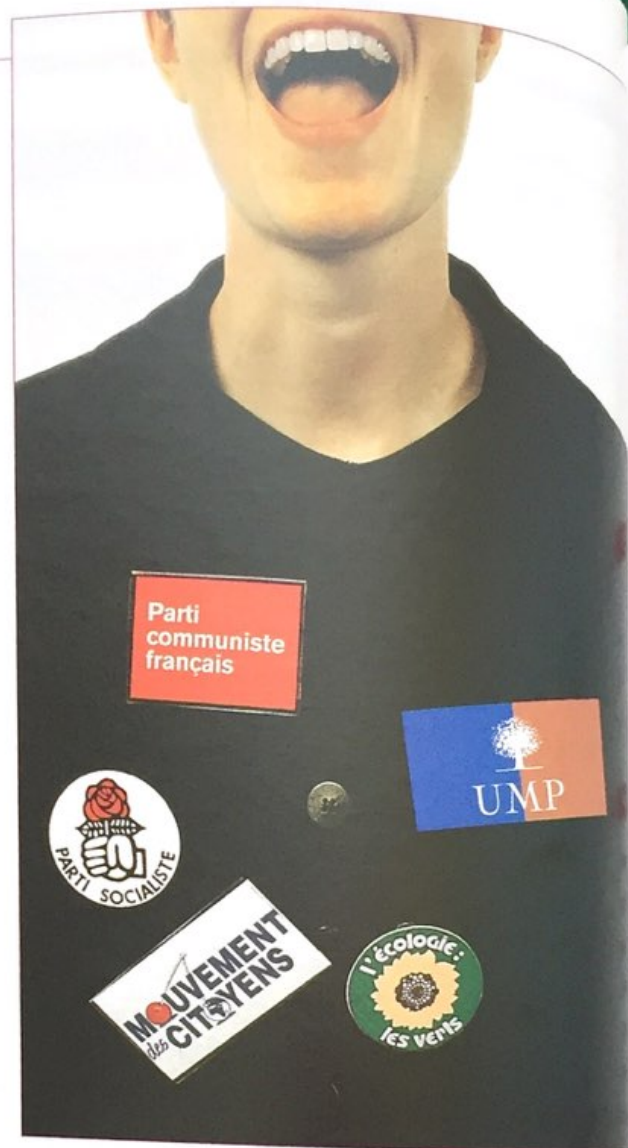
Badges de partis politiques.

- à l'extrême droite, le Front national (FN), mouvement héritier du slogan « Famille, travail, patrie » du régime de Vichy entre 1940-1944. Son leader, Jean-Marie Le Pen, a été le principal adversaire de Jacques Chirac pendant les élections présidentielles de 2002 ;