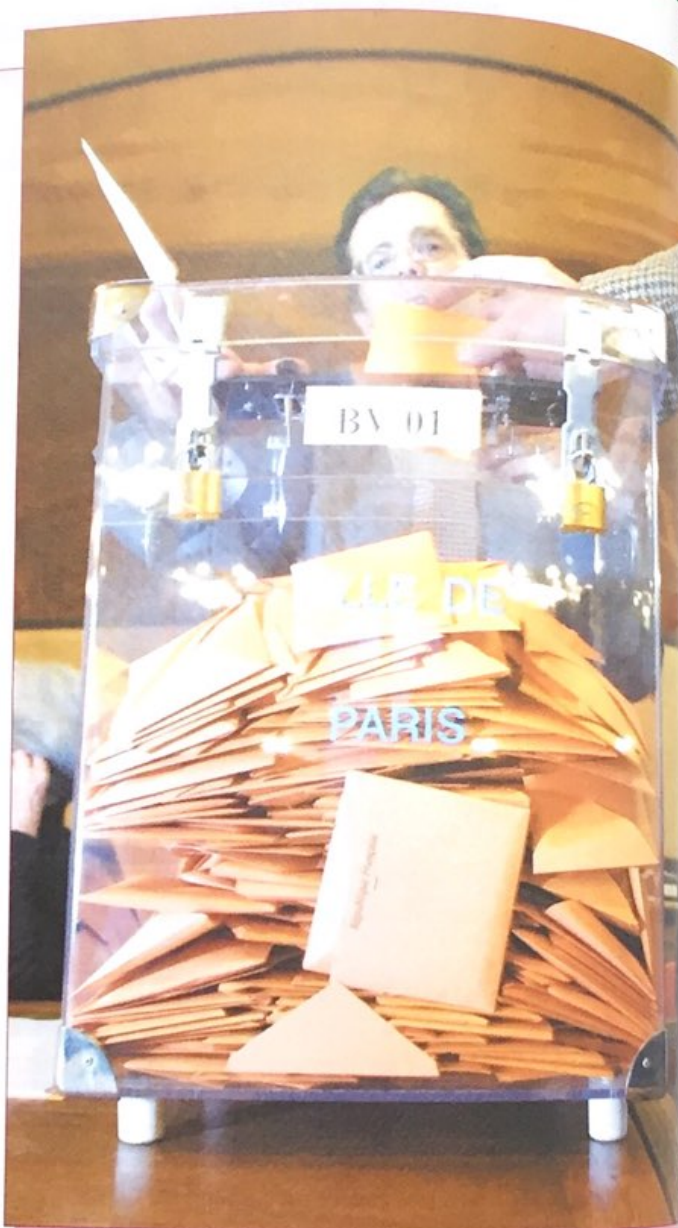
Les élections ont lieu le dimanche ! Chaque électeur met son bulletin de vote dans une urne.

Depuis 1986, les Français imposent par leurs choix aux élections une nouvelle forme de gouvernement : la cohabitation . Ainsi, un président de gauche a cohabité avec deux Premiers ministres de droite, et aujourd'hui un président de droite cohabite avec un Premier ministre de gauche. Comme si les Français refusaient la division entre droite et gauche que voudraient leur imposer les partis politiques.