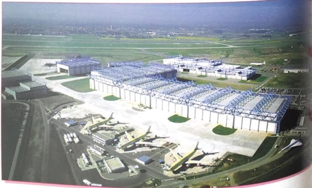
Les avions Airbus sont construits principalement à Toulouse.