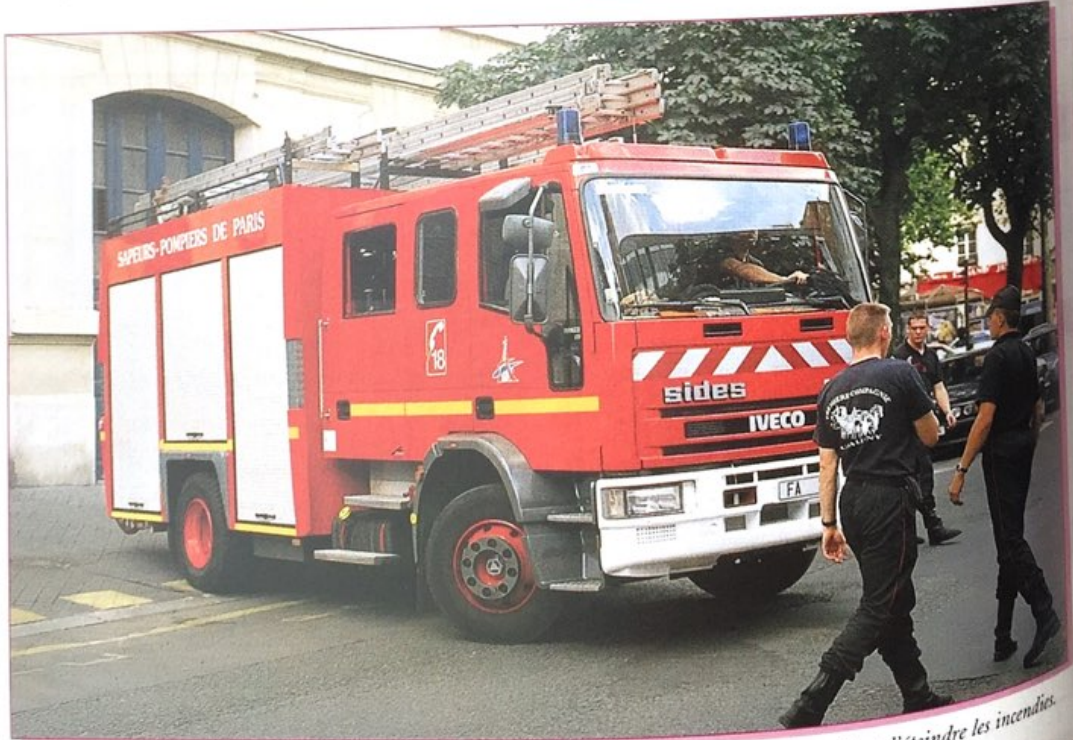
Les sapeurs-pompiers sont chargés d'apporter les premiers secours aux personnes en difficulté et d'éteindre les incendies.

Quant aux grandes institutions, ils placent en premier la police puis l'armée et enfin l'Église. La presse, les syndicats, les grandes entreprises ne les séduisent pas vraiment.